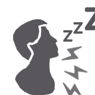
Gargouillements ou ronflements