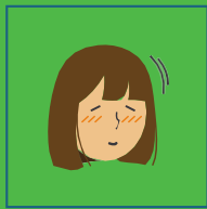
Tête qui tombe